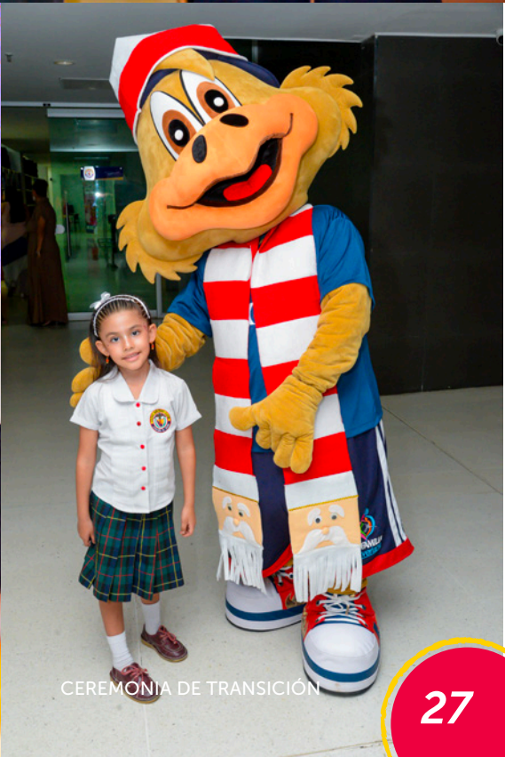
CEREMONIA DE TRANSICIÓN